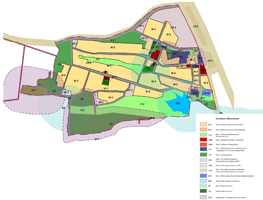
Рисунок 1. Карта градостроительного зонирования и зон с особыми условиями использования территории Георгиевского сельсовета